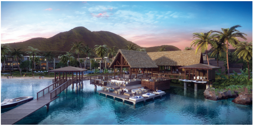
منطقة بناء المشروع الذي تنفذه شركة رينج ديفيلوبمنتس البيان

أعلنت "رينج ديفيلوبمنتس"، إحدى شركات التطوير الرائدة في قطاع الضيافة، أمس عن تعيين "كاير"، الشركة العالمية المتخصصة بالإنشاءات ومقرها المملكة المتحدة، لتنفيذ المرحلة الأولى من مشروعها "بارك حياة سانت كيتس". وتعد "Kier" جزءاً من مجموعة "كاير" المدرجة كشركة عامة على مؤشر "فوتسي 250" والتي تمتلك خبرة واسعة في منطقة البحر الكاريبي.